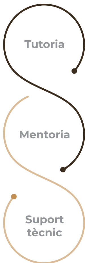
Figura 3. Agents imprescindibles per al suport integral.

La funció del suport integral inclou la formació especialitzada, el procés d'acompanyament al tester des d'un punt de vista tècnic, empresarial i personal, així com l'assessorament específic (Lozano Diéguez et al., 2020). Per poder dur a terme aquest suport integral, s'identifiquen tres figures imprescindibles: la tutoria, la mentoria i la persona tècnica.