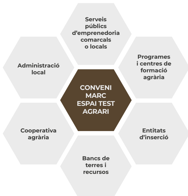
Figura 4. Tipologia d'agents integrants del conveni marc sobre espais test agraris.

Els convenis marc de col·laboració són instruments que contenen acords susceptibles de generar obligacions jurídiques entre les parts que els subscriuen. Perquè siguin efectius, exigeixen de manera expressa la formalització de convenis específics en els quals es concreten les obligacions esmentades, que han de respectar el contingut i els límits fixats pels convenis marc 5 .