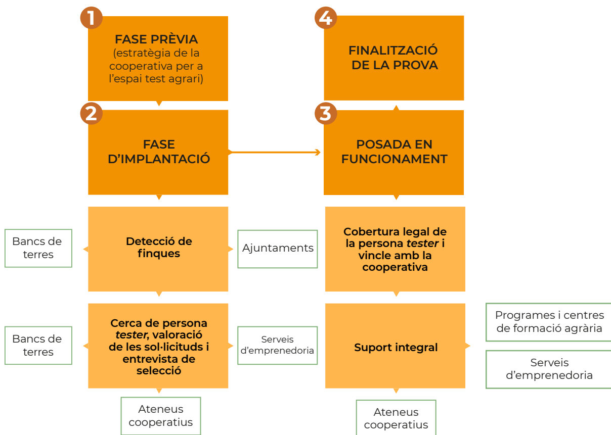
Figura 5. Mapa de col·laboració de les entitats integrants del conveni marc per a la implantació dels espais test agraris.

Poden oferir assessorament en la creació de cooperatives i en l'elaboració del pla d'empresa per a projectes d'autoocupació col·lectius, formació en cooperativisme, acompanyament en el coneixement i integració en xarxes de cooperació del territori, i la cooperació amb altres projectes productius, de consum o de serveis complementaris (grups de consum, xarxes de distribució agroecològica, etc.).